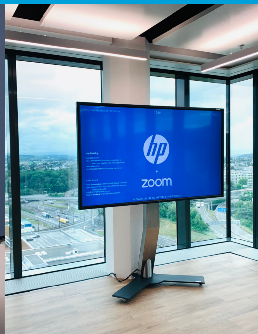
Ci-contre : huddle space avec solution ZOOM. Ci-dessus : support Axeos avec écran.

Afin d'optimiser la collaboration, d'avoir des visioconférences fluides et pour permettre à chaque participant d'être vu et entendu correctement, chacune de ces salles est équipée d'un système Logitech Rally ou de la solution HP Elite Slice G2 . De plus, plusieurs huddle rooms et petits espaces de travail ont été installés afin de faire des présentations et du partage de contenu très simplement.